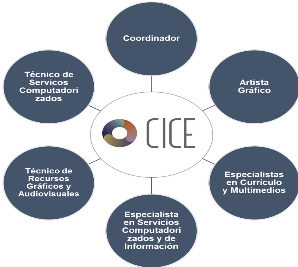
Figura 1. Componentes del Centro de Innovación y Creatividad en la Educación